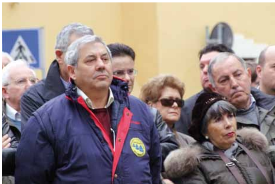
I Campanari e il pubblico in attesa