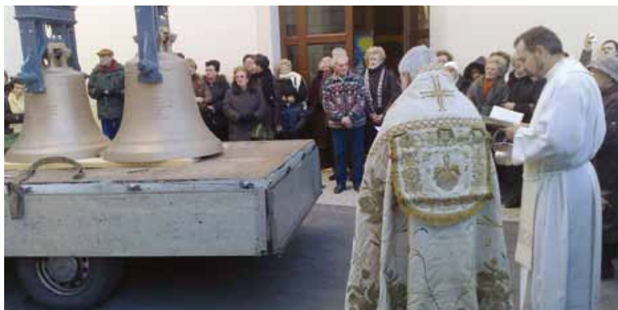
La Cerimonia di benedizione