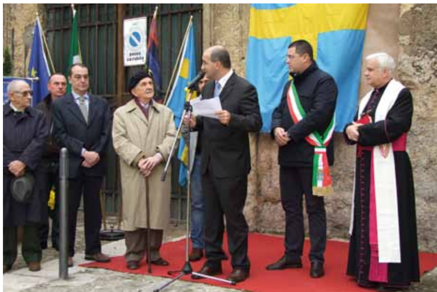
Cerimonia di benedizione della targa. Parla il Presidente