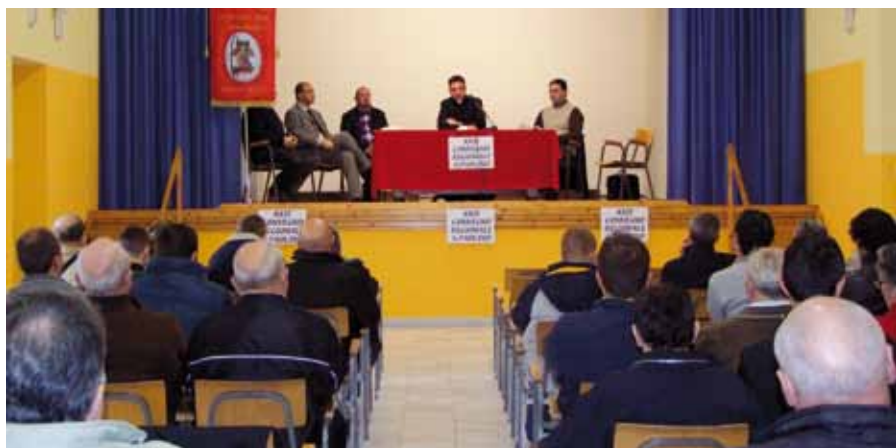
La sala del Convegno celebrativo di San Paolino