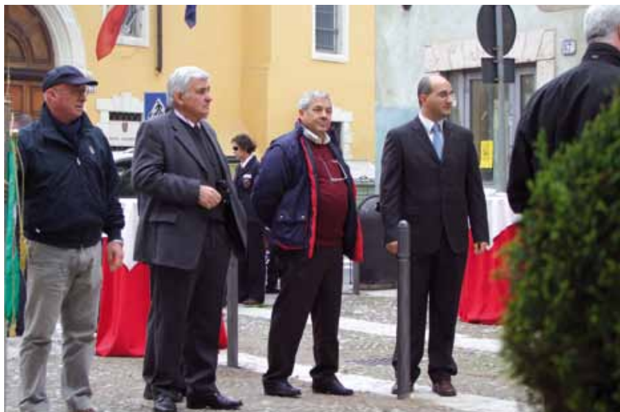
Inaugurazione e benedizione della Targa

Tra i suoi cavalli di battaglia è compresa anche la famosa campana di Rovereto "Maria Dolens" fusa nel 1938.