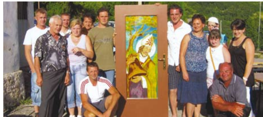
La Squadra di Finetti posa orgogliosa con la nuova porta della chiesa recante l'immagine di San Paolino da Nola, patrono dei Campanari.