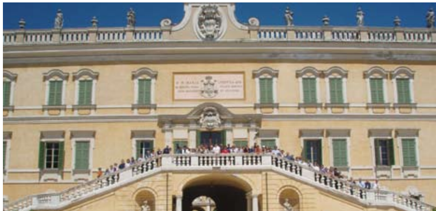
La Reggia di Colorno (PR), meta di una nostra gita culturale a Parma e Mantova-Laghi