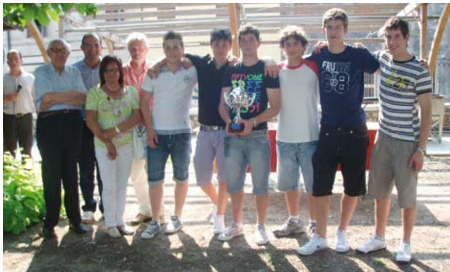
La magnifica compagnia che ha partecipato alla Gara: "Giovannissimi Under 18"