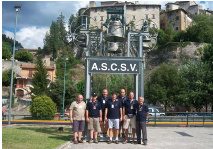
I nostri suonatori al Raduno Nazionale di Arrone