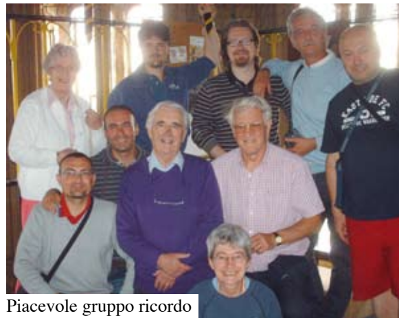
Piacevole gruppo ricordo

Venticinque anni dopo il primo incontro in terra inglese, un gruppo di campanari vicentini è ritornato a metà giugno sui luoghi dove si iniziò a parlare di gemellaggio, in quel di Malvern . Fu all'inizio dell'estate 1985 quando una comitiva vicentina partì alla volta dell'Inghilterra, la nostra Associazione era nata da pochissimo, per scoprire un modo