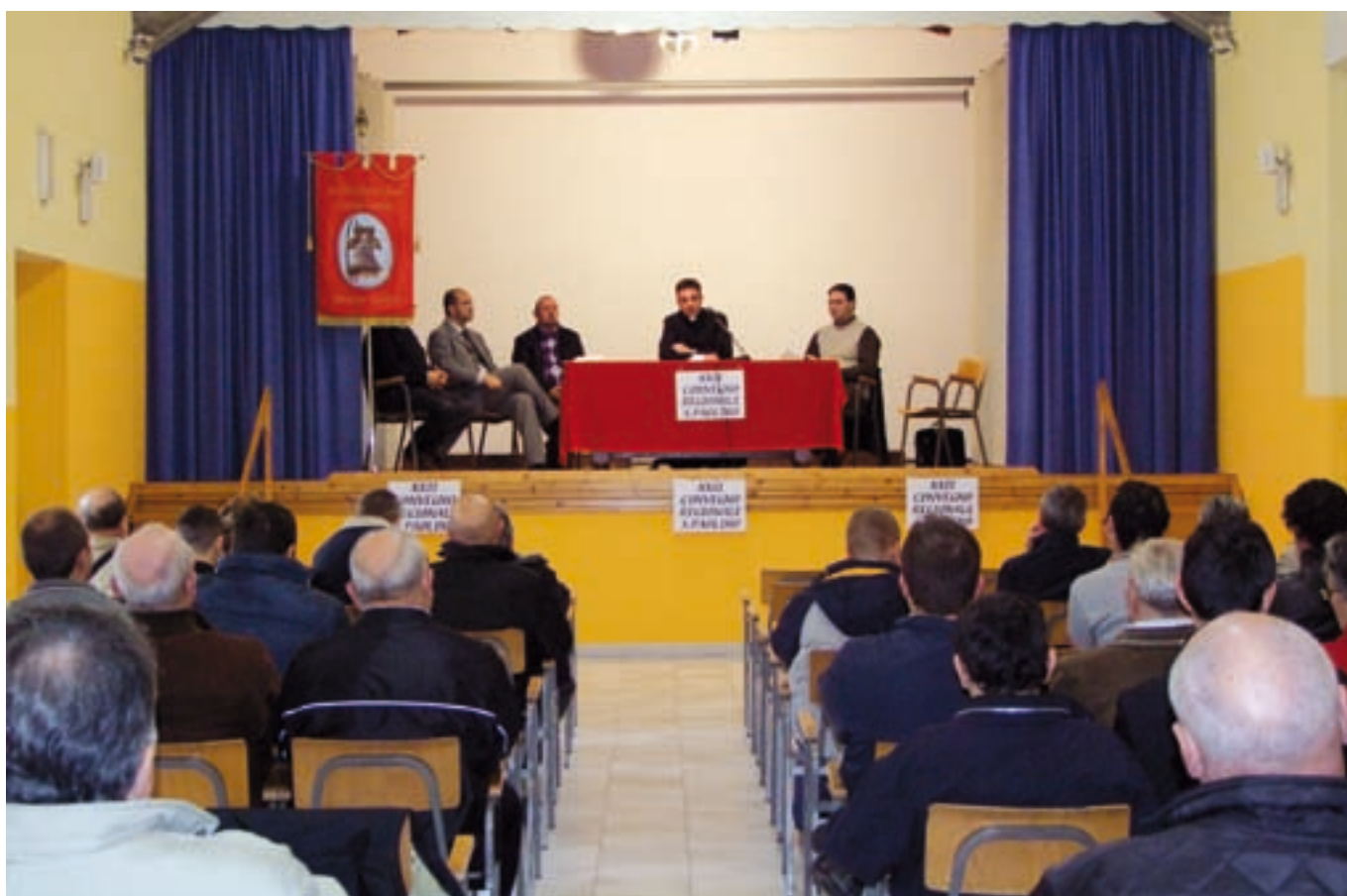
Sala del Convegno di S. Paolino - Patrono. Relatori e pubblico

« Cantate al Signore un canto nuovo. Spogliatevi della vecchia età, imparate il cantico nuovo. Nuovo l'uomo, nuovo il Testamento, nuovo il cantico. Il tuo cuore gioisca senza parole e il suono delle campane non abbia limiti nell'esprimere l'immensa profondità della tua gioia » ( S. Agostino)