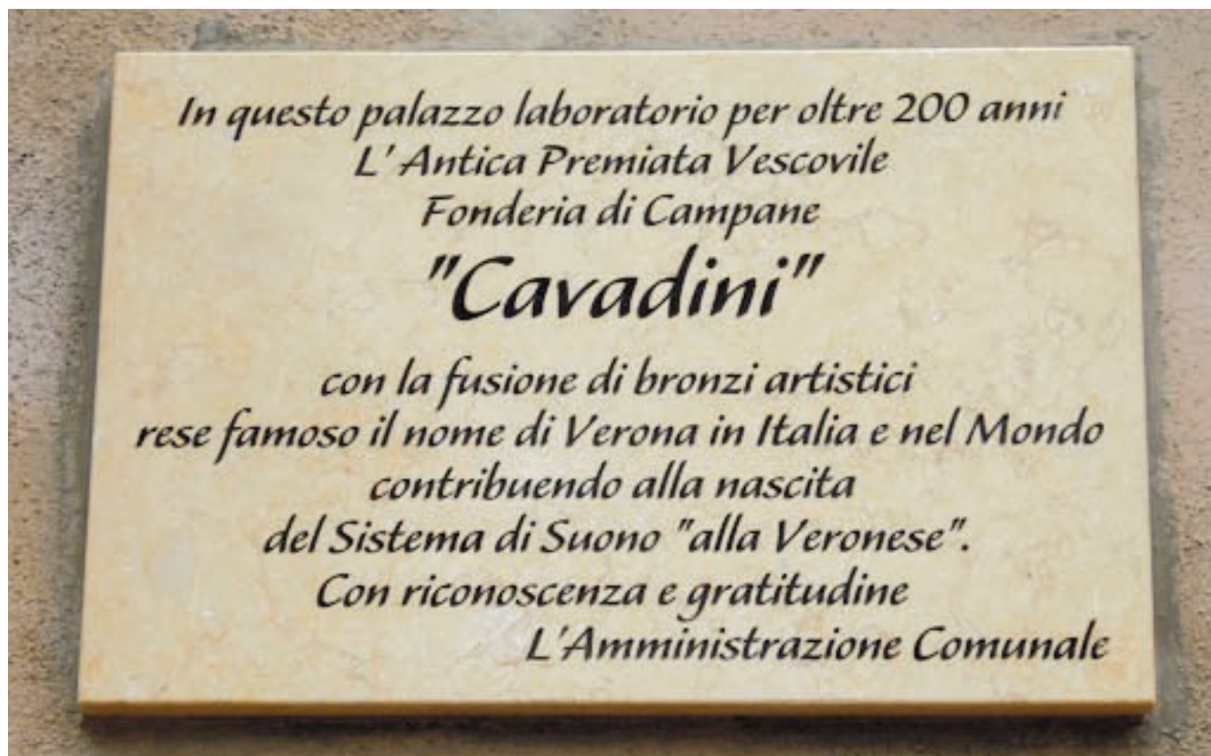
La targa inaugurata in via XX Settembre, 69 - Verona